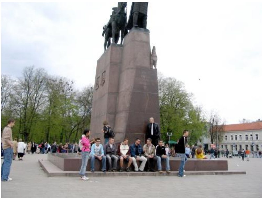
Po zwiedzaniu czas na zasłużony odpoczynek.