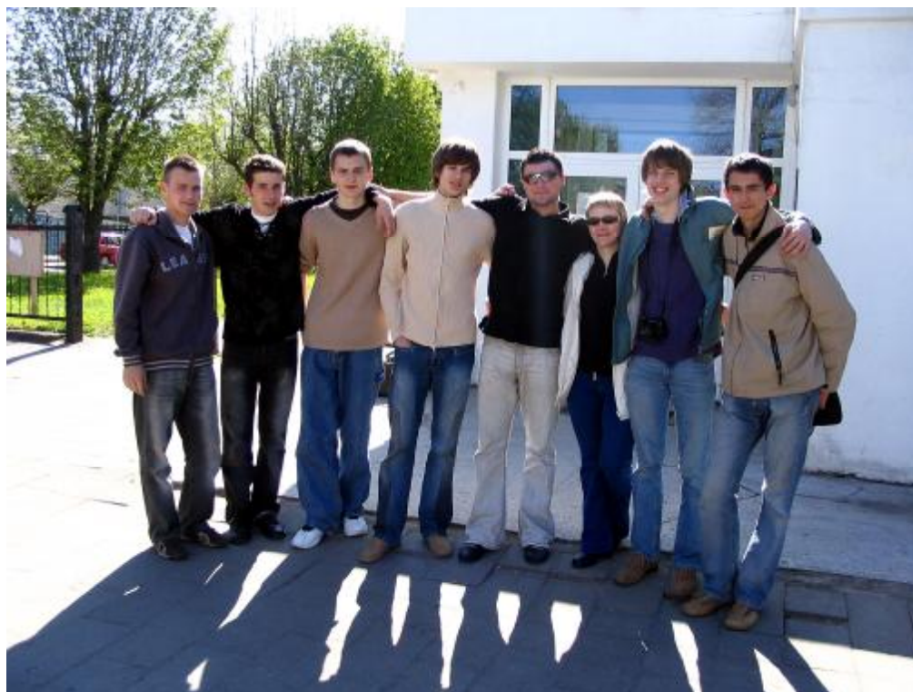
Przed halą Centrum Sportowego.