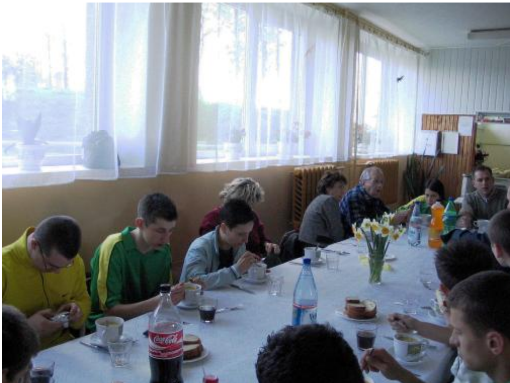
Czas na uzupełnienie zapasów energii przed kolejnymi meczami.