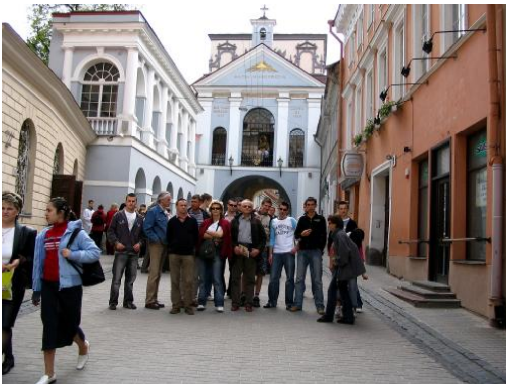
Przed Kaplicą Matki Bożej Ostrobramskiej.