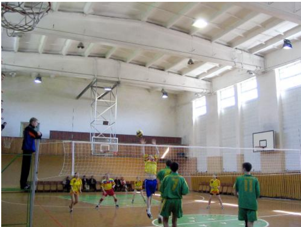
Nasi w ataku!