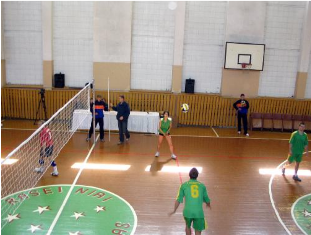
Rozgrzewamy się przed meczem.

W drugim dniu pobytu reprezentacja naszej szkoły wzięła udział w turnieju siatkówki w hali Centrum Sportowego Raseiniai. Zajęliśmy 3 miejsce w stawce sześciu zespołów z Rosji i Litwy. Walka była wyrównana, a poziom gry wysoki. Po zakończeniu zawodów nastąpiło wręczenie nagród i upominków oraz robiliśmy wspólne zdjęcia. Wieczorem wszyscy bawiliśmy się na spotkaniu zorganizowanym przez gospodarzy.