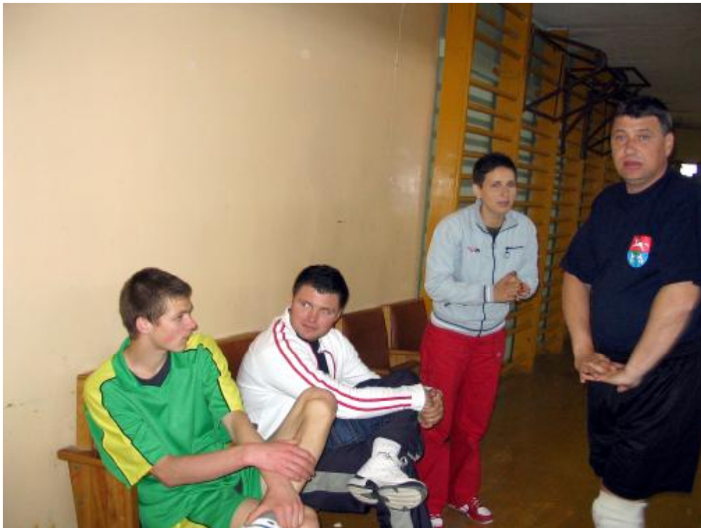
Ustalamy taktykę gry.