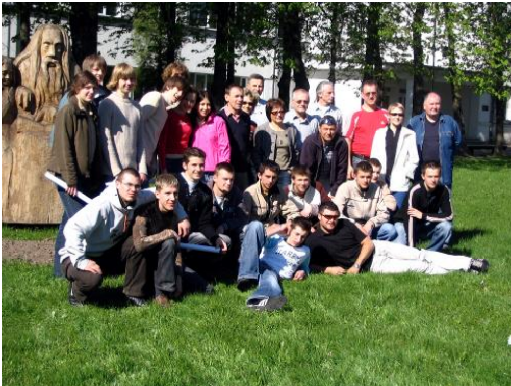
Wspólne zdjęcie przed wyjazdem.

W niedzielę 15 maja zostaliśmy bardzo serdecznie pożegnani i wyruszyliśmy w drogę powrotną, w czasie której zwiedziliśmy zabytki Wilna, m.in. Kaplicę Matki Bożej Ostrobramskiej, kościoły oraz Stare Miasto. Do Lubartowa dotarliśmy około północy.