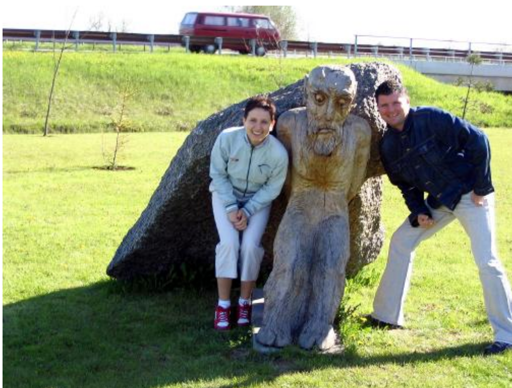
Rzeźba obok hotelu.