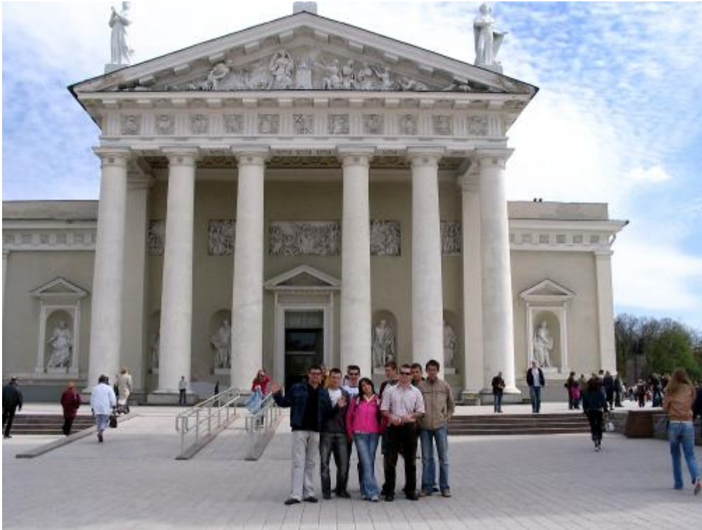
Przed jednym ze zwiedzanych kościołów w Wilnie.