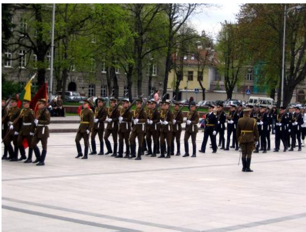
Maszeruje wojsko – defilada na Starym Mieście.

Wyjazd na Litwę dostarczył nam wielu niezapomnianych wrażeń, będziemy mile wspominać chwile spędzone z przyjaciółmi z Raseiniai. Na pewno chcielibyśmy tam jeszcze wrócić.