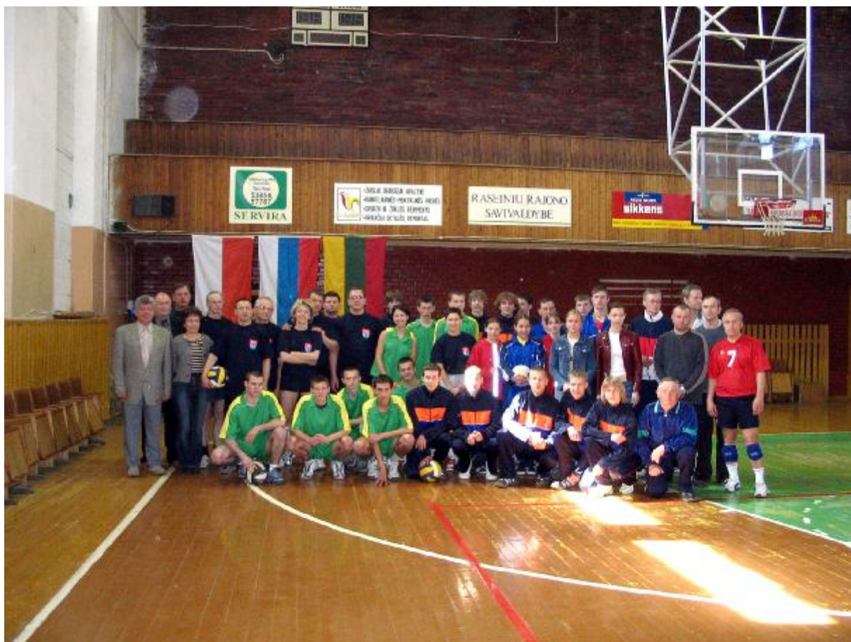
Wspólne zdjęcie wszystkich zespołów.