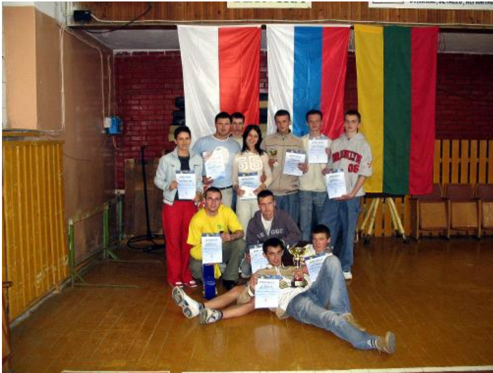
Nasza drużyna z pucharem i dyplomami.