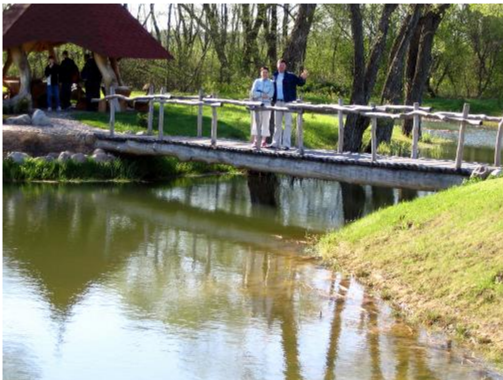
Otoczenie hotelu – prawda, że ładne miejsce ?

Dnia 13 – 15.05.2005 r. odbyła się wycieczka na Litwę do Raseiniai. Wyjazd ten odbył się w ramach współpracy szkół naszego miasta i szkół miasta Raseiniai. Celem wyjazdu było wzięcie udziału w Międzynarodowym Turnieju Piłki Siatkowej SPORT CUP 2005. Podróż była męcząca (trwała ok. 10 godzin), ale warta wysiłku. Na ten moment czekaliśmy tyle czasu, w końcu ukazał nam się znak drogowy z napisem – Raseiniai. Po wejściu do budynku szkoły zostaliśmy przywitani przez dyrekcję i młodzież. Po czym uczniowie udali się do rodzinnych domów Litwinów, a opiekunowie do malowniczo położonego hotelu.